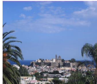
das Castello di Lipari