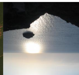
tramonto auf Lipari