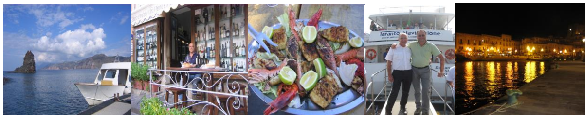
Landgang auf Salina