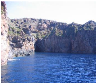
eine Bucht auf Vulcano