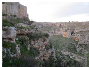
der Canyon von Matera