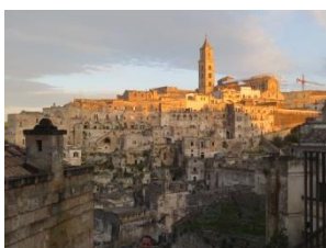
die „sassi“ von Matera