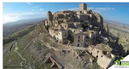
die Geisterstadt Craco