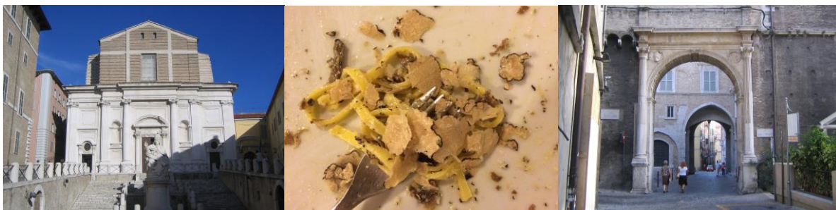
Piazza del Papa, Ancona

Der Trüffelsucher (hoffentlich –Finder) Franco Veroli wird vor und nach dem Frühstück am Hotelparkplatz schwarze Trüffeln und je nach Verfügbarkeit eine Auswahl an Trüffelprodukten und Olivenöl in guter Qualität und zu vertrauensvollen Preisen anbieten. Nachdem das Gepäck in den Bus geladen ist, fahren wir über die via panoramica über Monte San Vito und Morro d’Alba in die schöne Römerstadt Senigallia. Wir schlendern durch die Fußgängerzone und lassen uns im Hafen im Zwei-Sterne-Restaurant Uliassi – eines der besten Fischrestaurants an der Adria – bei Catia und Mauro mit einem überaus eleganten Déjeuner verwöhnen. Danach müssen wir leider zum Aeroporto fahren, denn die schöne, gemeinsame Zeit in der vielfach unbekanntenen Region Le Marche ist zu Ende.