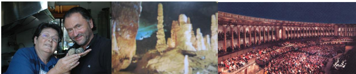
Marie-Antonia e tartufi

Am Spätnachmittag fahren wir dann mit dem Bus nach Macerata, der schönen Renaissance-Stadt. Nach einem kleinen, typischen Abendessen schlendern wir gemütlich durch die alten Gassen der Stadt zum Sferisterio, der ehrwürdigen Opernarena, die eine Halb-Elyse beschreibt – hier wurde schon im Jahre 1921 die Oper Aida aufgeführt - wir werden die besten Plätze haben. Auf sehr hohem Niveau und in einmaligem Ambiente werden die Oper Turandot von Giacomo Puccini sehen.